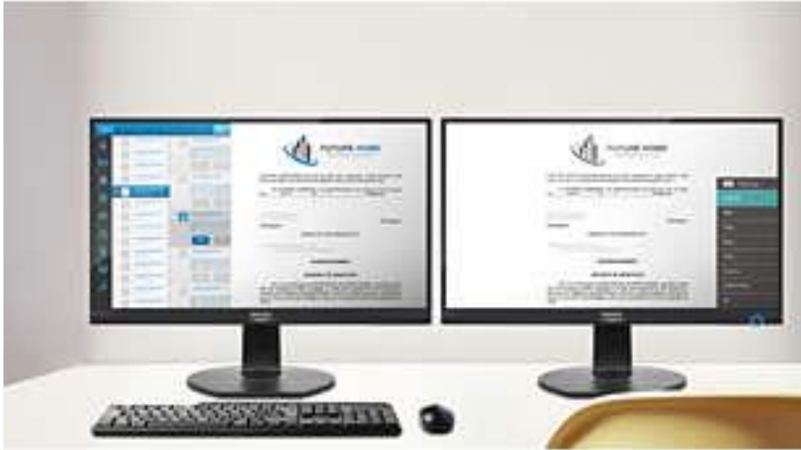
Modalità EasyRead per un'esperienza di lettura simile alla carta